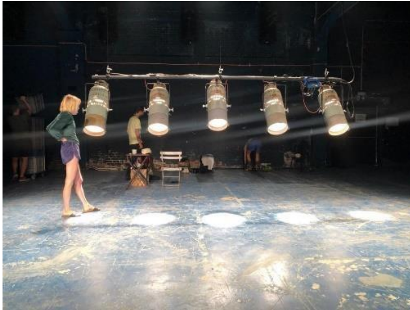
Beeld: Decor 'Anatole'