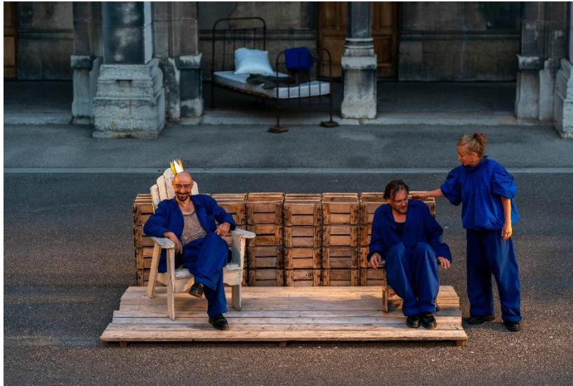
Beeld: scène uit Lorenzo de paljas van Florence