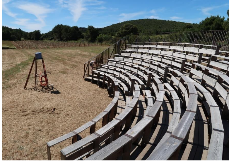
Beeld: Houten tribune van het gezelschap

In de zomer van 2008 werd ze (goed-)gekeurd conform de Europese veiligheidsnormen. ( Dossier Tribune op aanvraag).