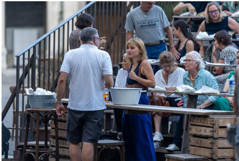
Beeld: publieksontvangst door acteurs

Naast het aangeboden water, kan in overleg met de organisator een aanbod drank en/of snack worden bepaald, bv limoncello, alcoholvrije amaretto, cantuccinni (Italiaanse zoete koekjes), ... Deze optie heeft extra logistieke en personeelsnoden (zie 6. Extra noden bij optie publieksontvangst).